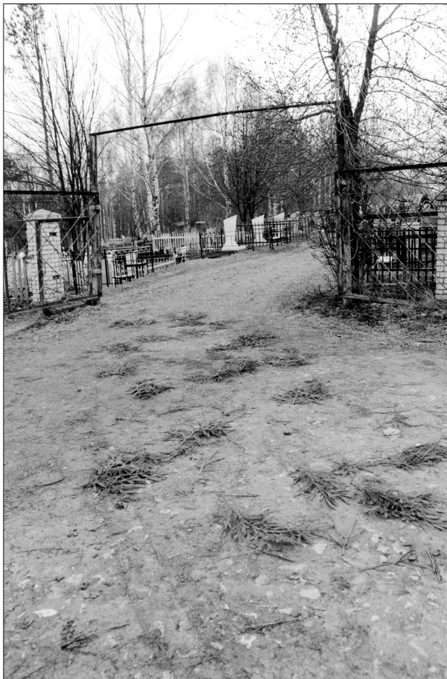
«Дорога покойнику», сделанная на кладбище

После выноса тела оставшиеся дома люди совершали очистительные обряды. Самым распространенным был обычай мести пол, при котором необходимо было соблюдать меры магической защиты: мести от двери к окну — чтобы в доме не было новых смертей: «Те, кто дома остается, полы моют и метут от двери» [118 — 3: ЦРФ — 1014]; «Мести надо от двери к окну, а то еще покойник в доме будет, еще кого-нибудь выметешь» [80 — 3: ЦРФ — Р — Э: 0003]. Пол могли не только мести, но и мыть, причем мытье начинали также от порога. Верили, что в таком случае покойник не будет возвращаться домой: «Оставляли людей, когда покойника выносили, тут моют, подметают,