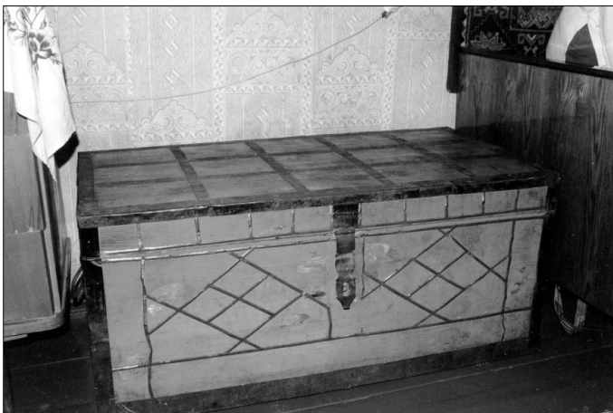
Сундук для приданого