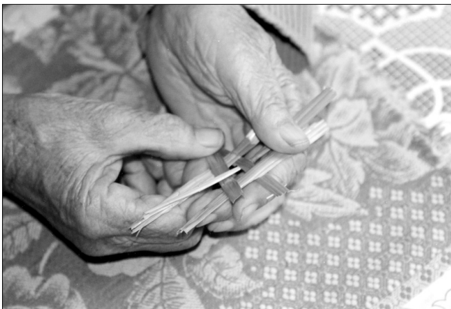
Изготовление свадебной птички-«гуленьки»

Во время угощения поезжан девушки поют величальные песни и получают за них вознаграждение. «А