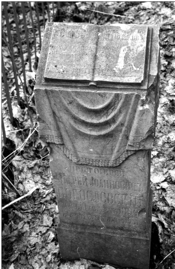
Мраморное скульптурное надгробие протоиерея А. И. Богословского с изображением аналога с раскрытым Евангелием. Всехсвятский погост Гороховца. Конец XIX в.

Несмотря на характерное для этого времени однообразие (унифицированность художественных решений и надписей), среди этих па-