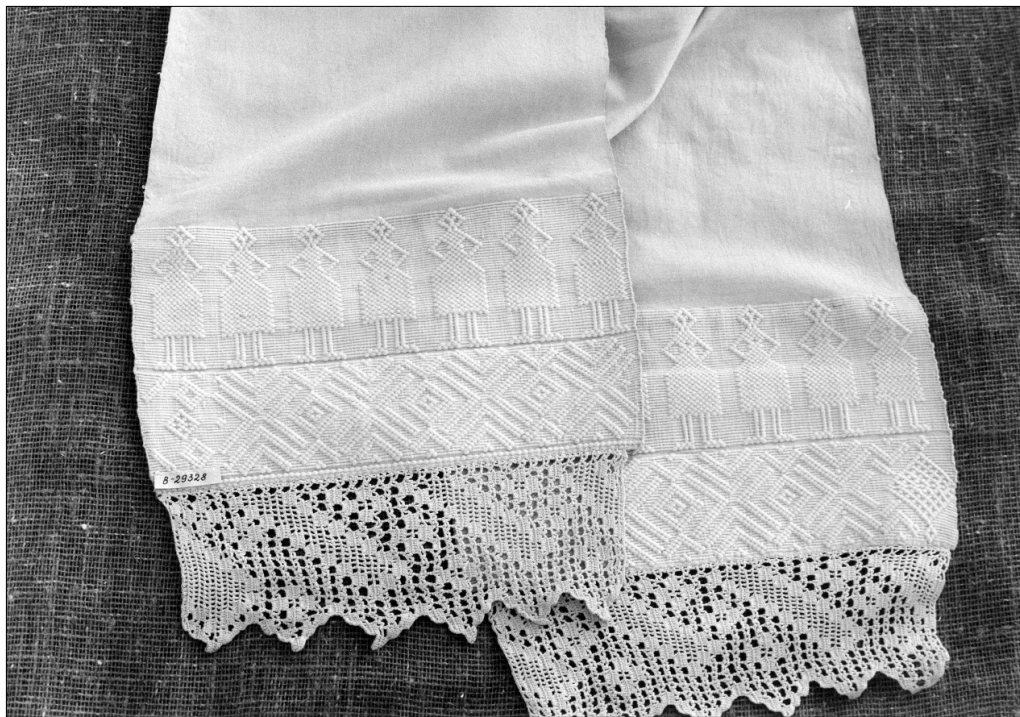
Полотенце из фондов Гороховецкого историко-архитектурного музея (B 29328)