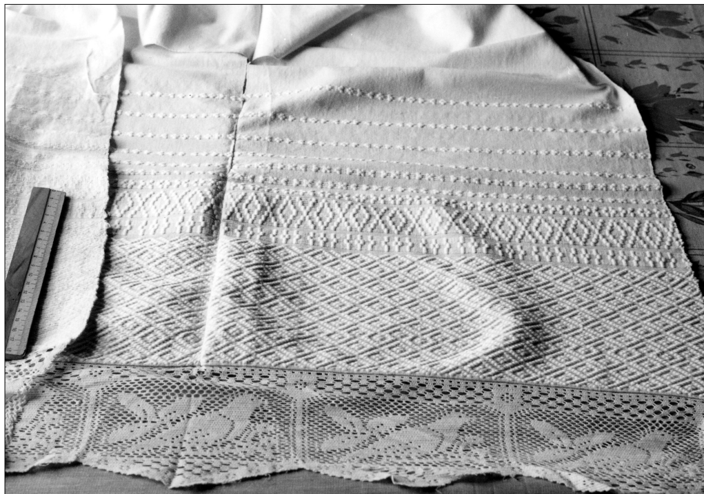
Полотенце на икону, д. Михальчугово