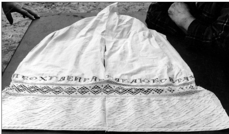
Полотенце Д.А. Полянской

них удельных селениях. Григорий Иванович (фамилии удельных крестьян указывались в редчайших случаях) был причислен в Липовскую образцовую усадьбу в 1845 г., несколько других выпускников — в 1842 г. Были созданы крепкие крестьянские хозяйства, построена мельница 6 . Почти полтора века потомки пер-