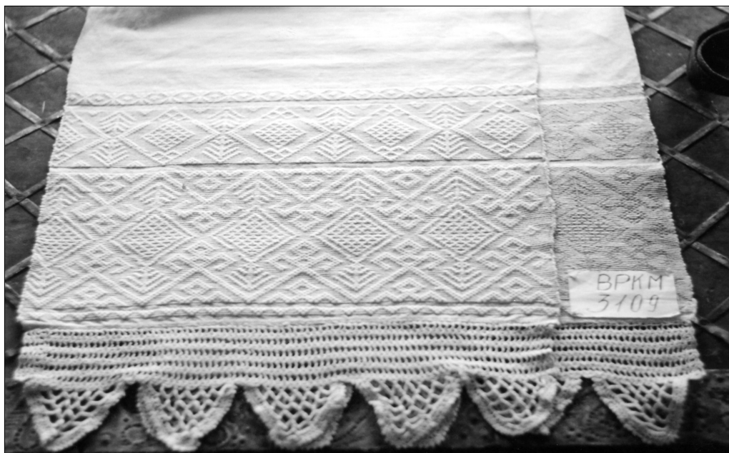
Полотенце из фондов Вязниковского историко-художественного музея (БРКМ № 3109)