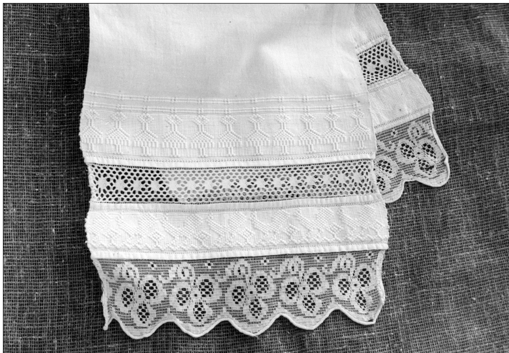
Полотенце из фондов Гороховецкого историко-архитектурного музея