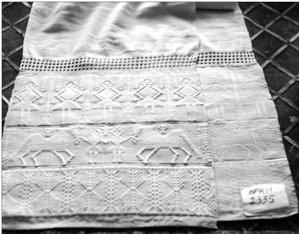
Полотенце из фондов Вязниковского историко-художественного музея (БРКМ №2335)