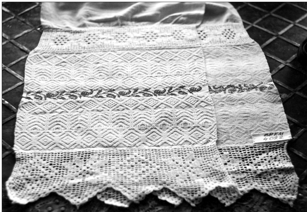
Полотенце из фондов Вязниковского историко-художественного музея (ВРКМ № 4022)

няя полоса, напротив, массивнее: ромбики с «сиянием» вовне и «головастиками» по вершинам повторены дважды друг над другом. «Сияние» здесь также более массивное, в две линии выпуклых точек. Вследствие этого центральная полоса стала не относительно узкой, т.е. промежуточной, а самой широкой. Нижняя полоса из-за этого перестала привлекать основное внимание, тем более что фигуры «берегинь» здесь искажены: они лишились верхних частей «торса», загнутые «ручки»-крючочки исходят непосредственно из сторон ромба. «Берегини-рожаницы» в углах между ромбами вместе с верхними частями «торса» лишились и «ручек». Тонкий рабочий уток во всех орнаментальных полосах — белый, но сами полосы отделены друг от друга тонкими красными акцентами по краям полотняных пробелов. Интересная деталь: по середине каждого из этих узких пробелов проходят полоски очень узкой мережки — прием, не встречавшийся нам на полотенцах такого рода. Быть может, это случайное применение мережки, но не исключено, что отголосок древней традиции 15 . Край полотенца