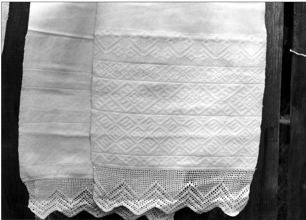
Полотенце Н.К. Панфиловой, д. Олтушево

веточки-проростки, а развесистые растения с цветами или плодами, очень похожие на «деревья» в верхней полосе полотенца № Т-3051 из Государственного Русского музея 13 , приобретенного в Гороховецком районе.