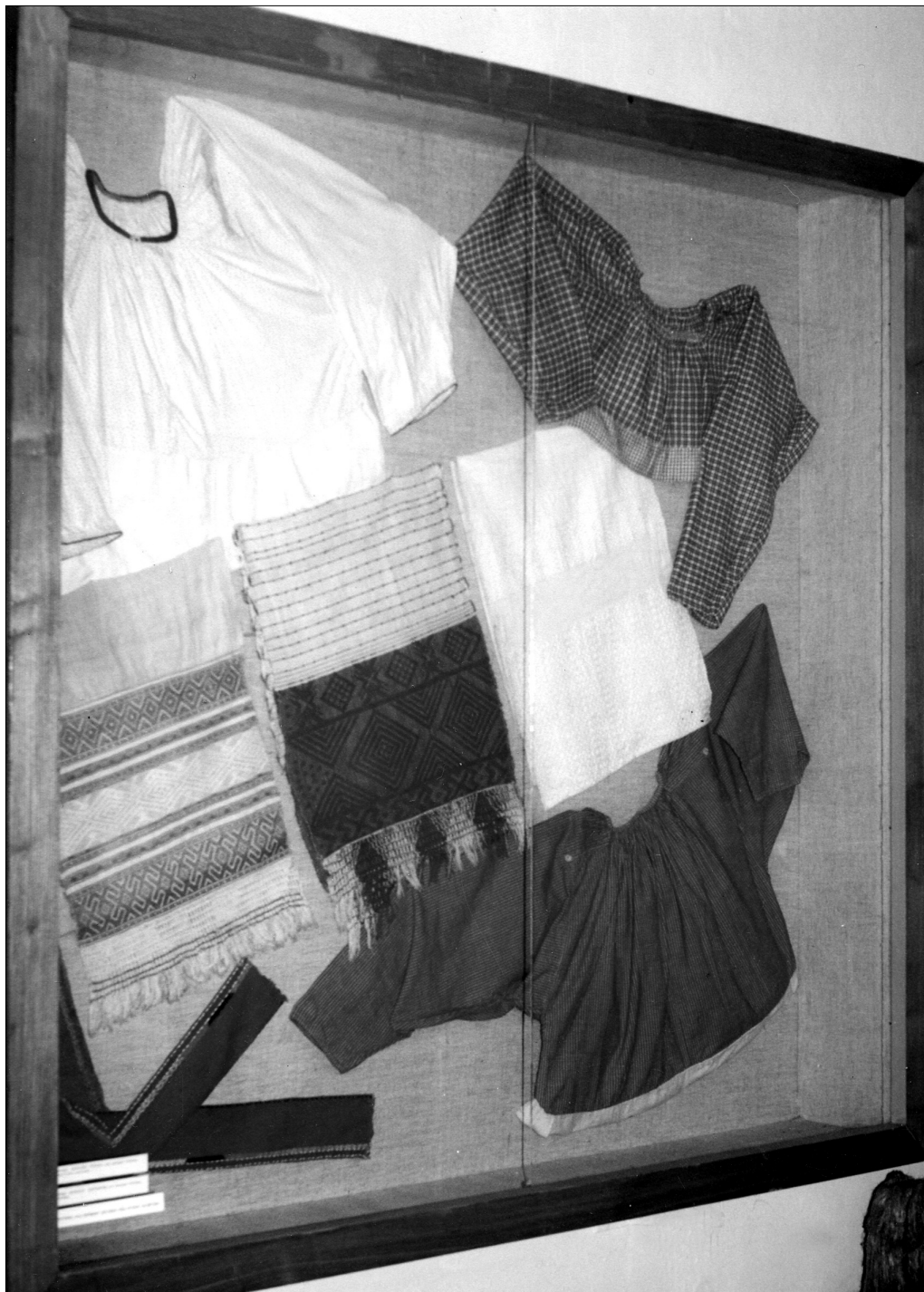
Витрина музея Центра традиционной культуры, с. Фоминки. Слева — полотенце ГФМ № 117. В центре — полотенце ГФМ № 113. Внизу слева — наподольницы