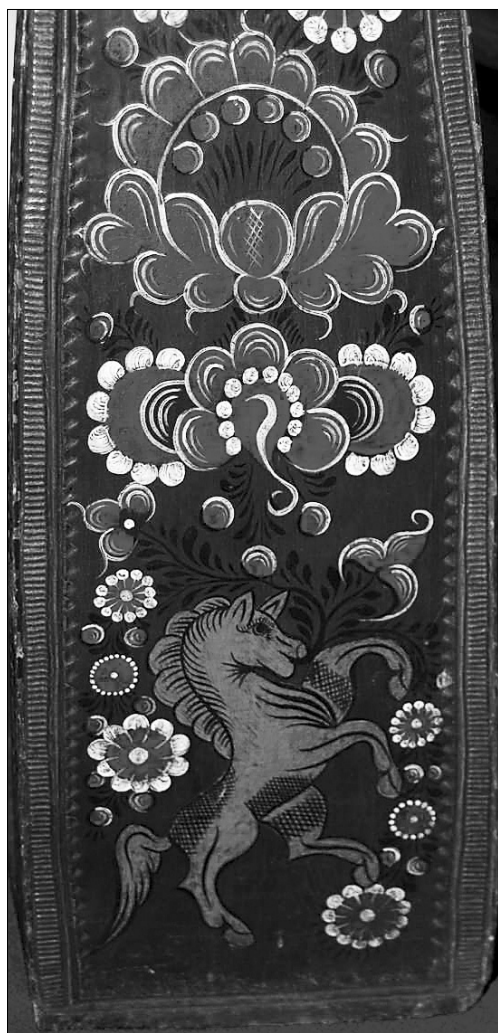
Рис. 2. Конь

Перед началом работы был проведен визуальный анализ прялок, а затем их повторно исследовал художник-реставратор темперной живописи 1-й категории Н. Н. Федышин с помощью микроскопа МБС-10. После совместного исследования был сделан вывод о том, что в росписи данных прялок применялись сусальное золото и лаковая живопись, характерная для иконописных школ XVIII—XIX вв. Грунтом служил левкас, для приготовления которого применяли осетровый клей, мел или гипс.